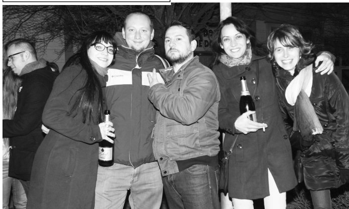
Silvestrovská nálada na veľkokrtíšskom námestí bola výborná