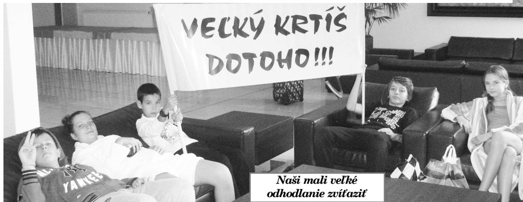
Naši mali veľké odhodlanie zvíťaziť