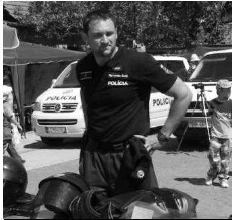
Policajti ochotne odpovedali na zvedavé otázky detí a trpezlivo predvádzali ukážky svojej práce.

Žiaci z oboch škôl sa zaujímali o všetko, čo si pre ne policajti a hasiči pripravili. Vyskúšali si hasičskú striekačku, jazdu v hasičskom aute, pozreli si techniku, ktorú pri svojej práci používajú dobrovoľní hasiči. Pozorne sledovali prácu policajných psodovov so svojimi psami, nechali si zobrať odtlačky prstov, skúsili aké to je fúkať do prístroja na zisťovanie množstva alkoholu v krvi a zaujímali sa o výzbroj a výstroj policajtov. Veď vyskúšať si ochranný odev policajtov, obranné štíty, obušok, alebo poťažkať brokovnicu či pištoľ, sadnúť si do policajného auta či na policajnú motorku, ktorú obdivovali chlapci i dievčatá, nemôžu každý deň. Ako na záver skonštatovali technici, ešte nikdy nebrali toľko odtlačkov prstov a nikdy nebol taký záujem o analyzátor dychu. Minuli všetky náustky, ktoré mali pre záujemcov o zisťovanie alkoholu v krvi pripravené, ale ani jeden z testov na alkohol nebol pozitívny - veď testovali deti.