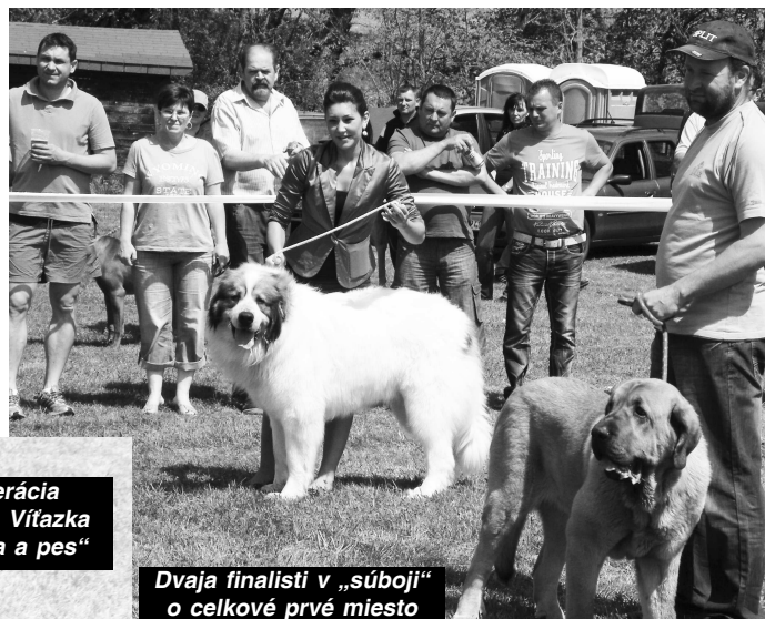
Dvaja finalisti v „súboji“ o celkové prvé miesto

pastierski psy sú pod rôznymi pomenovaniami ako Kuvás, Slovenský čuvač či Maremsko - Abruzský pes... Pyrenejský horský pes je rozšírený od Karpát cez južnú Európu až po Pyreneje. Nemožno im však uprieť spoločné črty a znaky. Biela farba týchto psov používaných na ochranu stád pred zverou bola vyšľachtená už antickými poľnohospodármi. Pyrenejský horský pes, i keď je jednoznačne pastierskym psom, zdobil dvor francúzskeho korunného princa syna Ludvíka