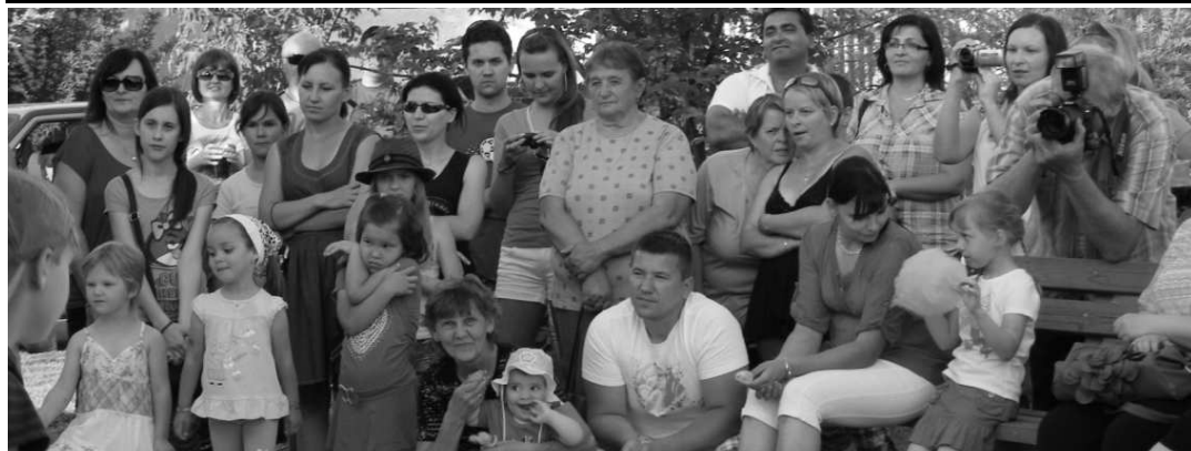
Bohatý program, ktorý si žiaci pripravili pre svoje mamy, zaujal rodičov, starých rodičov i súrodencov.