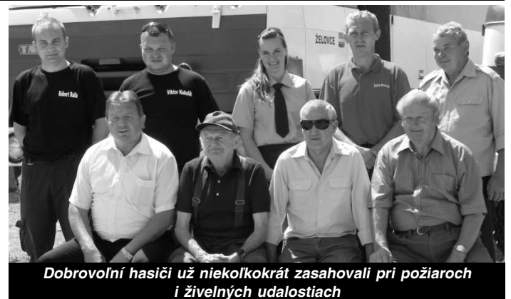
Dobrovoľní hasiči už niekoľkokrát zasahovali pri požiariach i živelných udalostiach

Okrem toho sa členovia DHZ pravidelne zúčastňujú okresných súťaží, na ktorých dosahujú dobré výsledky. Aby sa na svoju činnosť dobre pripravili, potrebujú hasiči aj dobré podmienky - dobrú hasičskú zbrojnicu. Tú, ktorú doteraz používali, postavili v obci ešte v