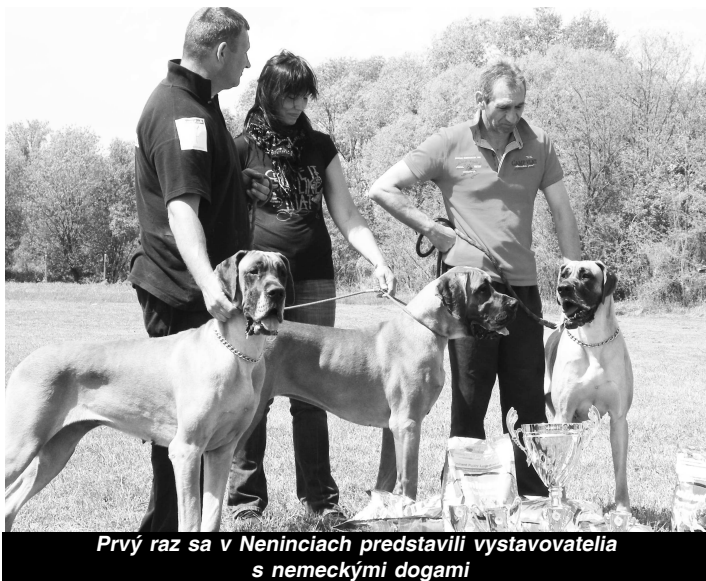
Prvý raz sa v Neninciach predstavili vystavovatelia s nemeckými dogami

„Šteniatko pyrenejského horského psa sa dá kúpiť aj za 300 eur, ale kvalitnejšie sa pohybujú od 600-700 eur nahor. Samozrejme,