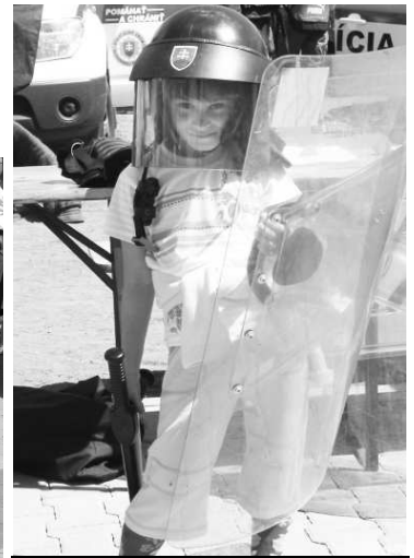
Výzbroj ťažkoodenca si vyskúšala aj malá Vikinka.