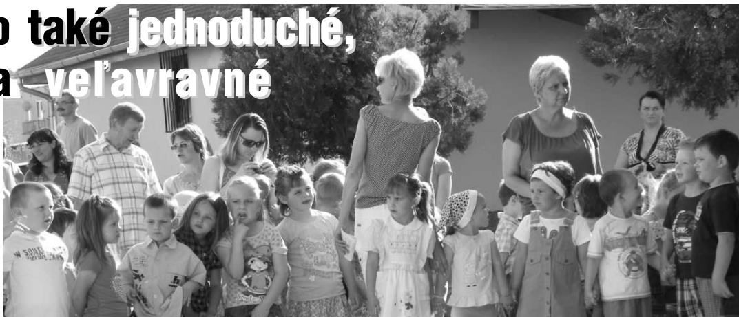
Škôlkari sa vystúpenia pred svojimi mamičkami nevedeli dočkať.