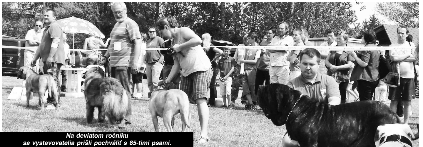
Na deviatom ročníku sa vystavovatelia prišli pochváliť s 85-timi psami.