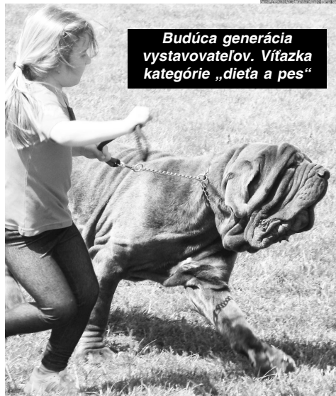
Budúca generácia vystavovateľov. Víťazka kategórie „dieťa a pes“