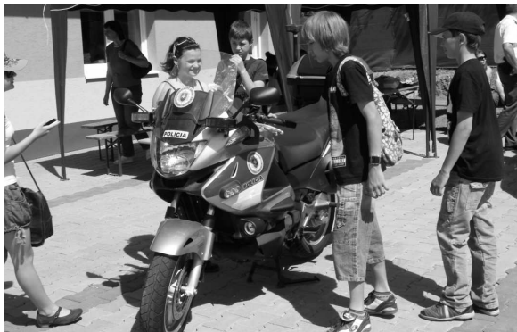
Pozornosť chlapcov i dievčat pútala aj policajná motorka.

Vari každý z nás v detskom veku aspoň raz zažil vyskúšať si prácu policajta či hasiča. Túto túžbu deťom v Želovciach priblížili členovia Dobrovoľného hasičského zboru (DHZ), ktorí spolu s príslušníkmi Okresného riaditeľstva policajného zboru vo V. Krtiši (OR PZ) pripravili pre žiakov ZŠ s MŠ v Želovciach ukážky z práce policajtov a dobrovoľných hasičov. Záujem o túto zaujímavú prezentáciu prejavili aj žiaci zo ZŠ na Komenského ulici vo V. Krtiši a do areálu požiarnej zbrojnice v Želovciach prišli deti z troch tried tejto školy. Počas dopoludnia sa tu vystriedalo približne 300 žiakov a množstvo detí hasičov i prácu policajtov príjemne prekvapilo.