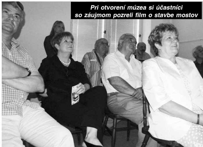
Pri otvorení múzea si účastníci so záujmom pozreli film o stavbe mostov