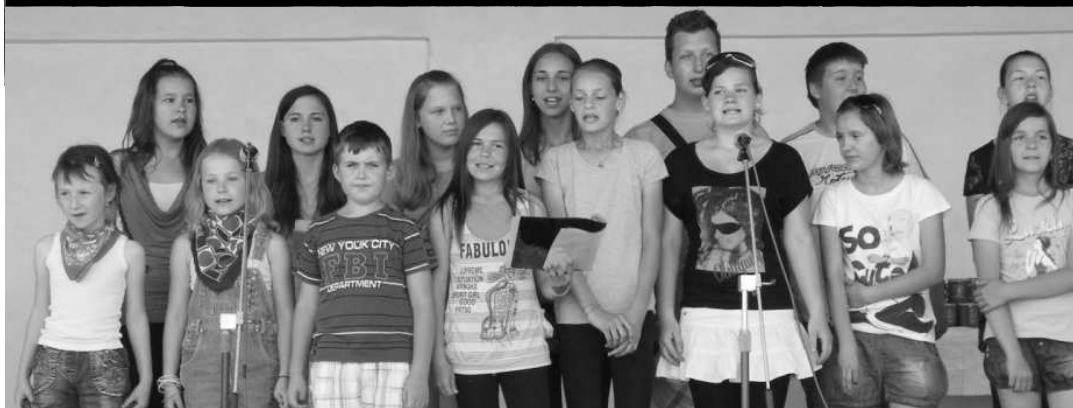
Žiaci druhého stupňa pozdravili svoje mamy aj spevom.