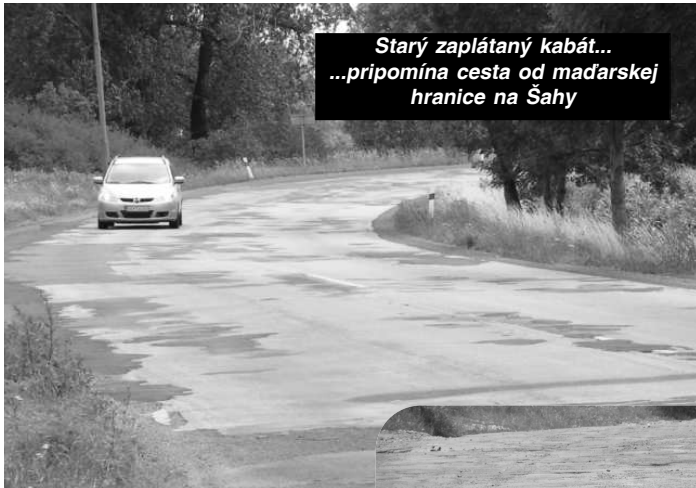
Starý zaplätaný kabát... ...pripomína cesta od maďarskej hranice na Šahy