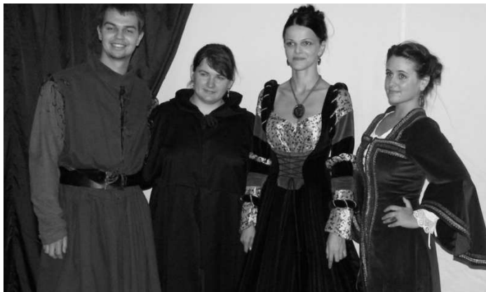
Predstavenie skončilo, ďakujeme