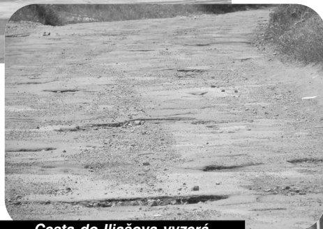
Cesta do Iľiašova vyzerá ako mesačná krajina - „kráter na krátri...“

Ešte v čase prípravy reportáže o cestách okolo S. Ďarmôt, nás obyvatelia obce upozornili aj na úsek cesty III/527 017 medzi S. Ďarmotami a Opatovskou Novou Vsou. Na približne 30 metroch sa cesta prepadla kvôli zosuvu pôdy počas povodní v roku 2010. Doteraz sa tento úsek nepodarilo opraviť a preto sme kvôli tomuto problému navštívili