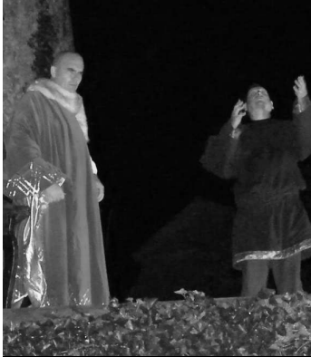
Sluha prináša správu

Nočné prechádzky na modrokamenskom hrade sa už stali neodmysliteľnou súčasťou letných podujatí, ktoré pre návštevníkov pripravujú pracovníci SND Múzeum bábkarských kultúr a hračiek, hrad M. Kameň.