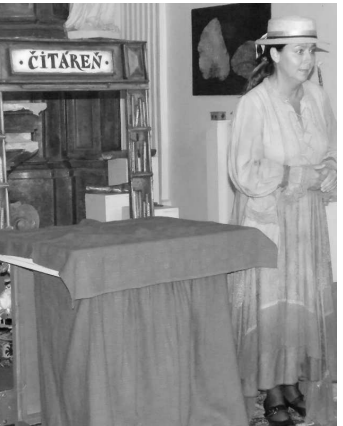
Teátro Neline zaujalo malých i veľkých divákov

Počasie a dažď však menili program a v úvode večera si mohli návštevníci pozrieť predstavenie bábkového divadla Teatro Neline v hradnej kaplnke