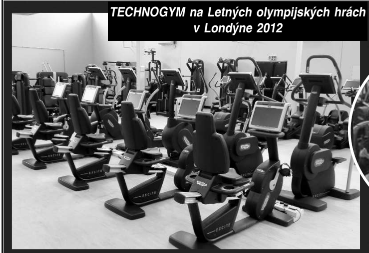
TECHNOGYM na Letných olympijských hrách v Londýne 2012