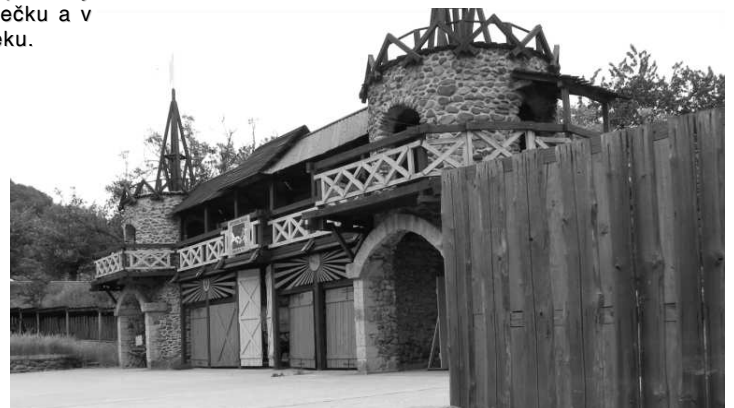
Toto jedinečné pódium - tak ako veľa vecí a miest v Hrušove - bude tento víkend opäť zažívať nápor účinkujúcich a divákov.

raz za čas nový venček a občas - napríklad na pamiatku zosnulých tam horia aj kahance. Jej deti mi vtedy povedali, že budú každý rok na parádu chodiť ako na mamkinu pamiatku, a asi si to tak zariadili, že niekoho poprosili, aby za nich chodil na to, pre nich, smutné miesto. Viete, aj po tých rokoch sa mi tísnu slzy