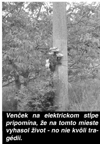
Venček na elektrickom stípe pripomína, že na tomto mieste vyhasol život - no nie kvôli tragédii.

Práve oni mi porozprávali, že ich mamička videla minulý rok v