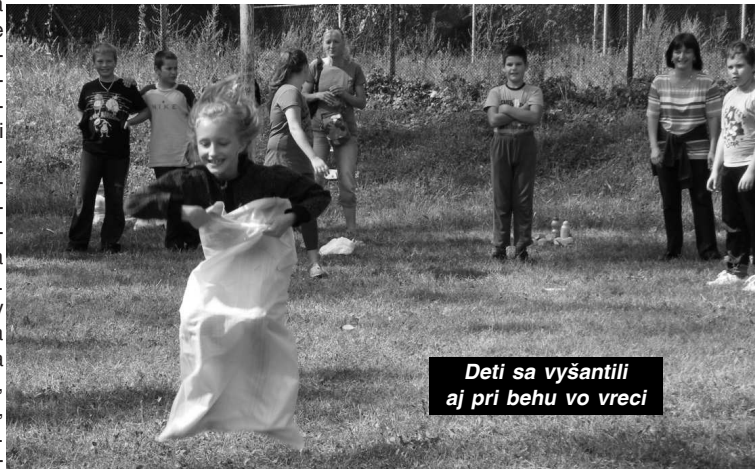
Deti sa vyšantili aj pri behu vo vreci

Deti sa vyšantili pri štafetovom behu, kde museli zdolať rôzne prekážky, hode loptičkou na cieľ, ale najviac zábavy si asi užili pri terénnom behu. V ňom deti rozdelené do družstiev hľadali písmenka rozmiestnené po celom areáli a z