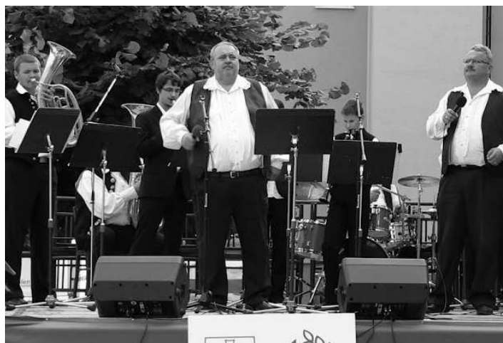
Cenu za najlepší inštrumentálny výkon si odniesli Sebechlebskí hudci