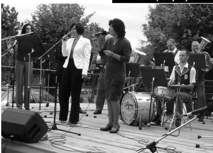
Domacia Hradčianka získala Cenu diváka