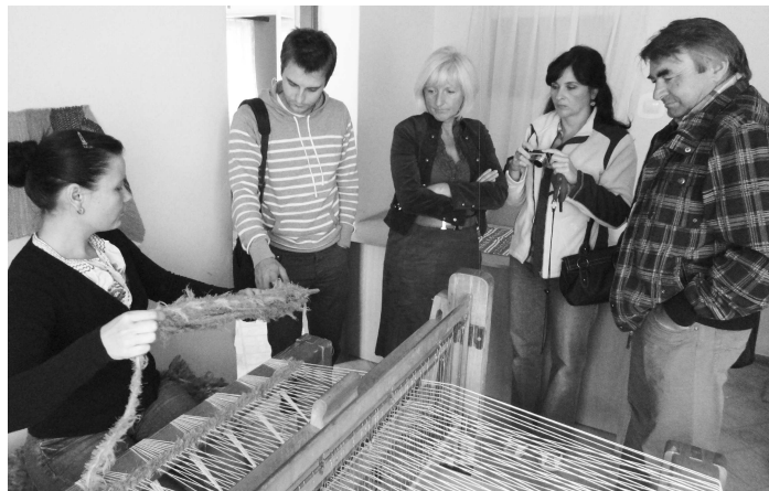
Prvá návšteva z MAS OZ Zlatá cesta

"Vysoká nezamestnanosť, nedostatok finančných prostriedkov sú faktory, ktoré dokážu ničiť živobytie rodín, nehovoriac o tom, keď sú tieto skutočnosti sťažené zdravotnými prekážkami. Tieto problémy trápi mnoho rodín, jednou z nich bola aj naša. Pred pár rokmi sa zdravotný stav mojich rodičov veľmi zhoršil i napriek tomu spravili všetko preto, aby nás s bratom mohli podporovať v štúdiách. Horko - ťažko, ale školy sme úspešne zvládli. Ostali sme doma vyštudovaní ale bez zamestnania. Bohužiaľ, zdravie rodičov sa stále zhoršovalo, potrebovali našu pomoc. Dlhú som hľadala možnosti doma aj v našom hlavnom meste, kde ma však odradili vysoké ceny podnájomov."