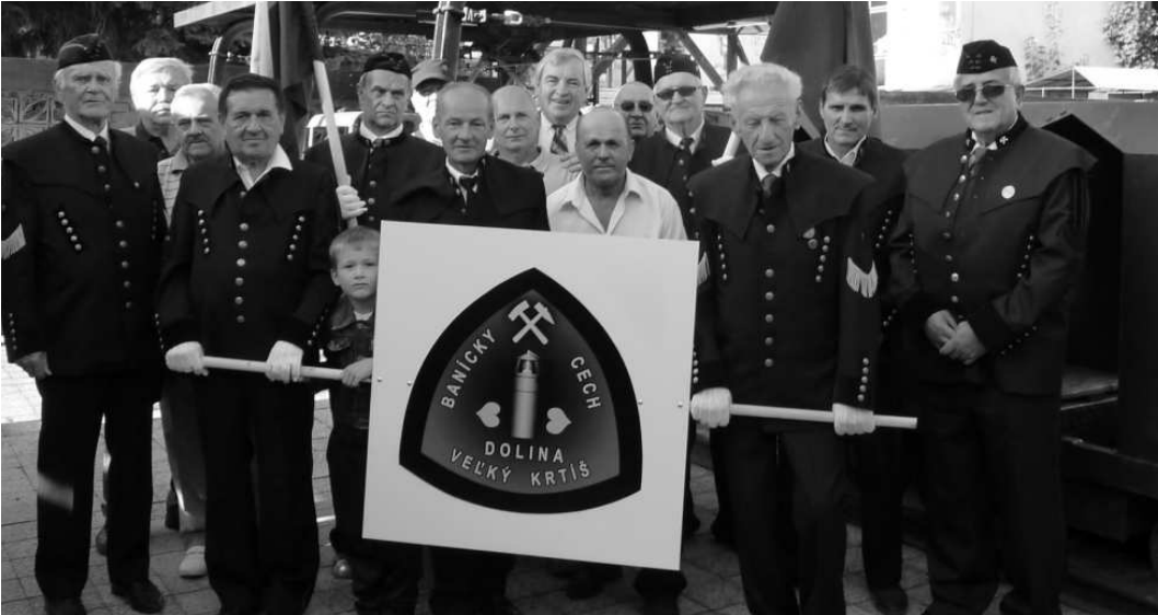
Banický cech Dolina sa Veľkokrtišanom predstavil aj so svojim novým znakom. Sprievod mestom zakončili baníci pri banickej lokomotive „Na platni“

ale nechcú sa zmieriť s tým, že z banickej slávy ostal iba jarmok, ktorý baníctvo pripomína iba názvom. Aby spomienka na baníctvo vo V. Krtíši nevymizla úplne, usporiadali členovia cechu sprievod, ktorého sa