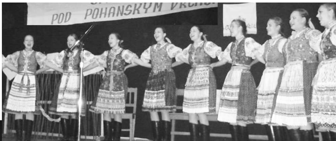
Folkloristi z Hrušova sa prezentovali na vysokej úrovni a postúpili na krajské kolo.