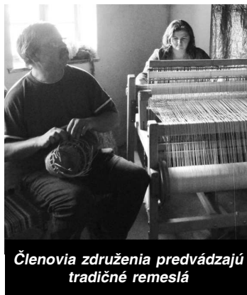
Členovia združenia predvádzajú tradičné remeslá

Myšlienkou združenia je zachovať zvyky, tradície, remeslá a kultúru nášho okolia. Na tento účel sme začali s opravou starého domu, v ktorom by sme v budúcnosti chceli priblížiť ťažký, ale veľmi hodnotný život našich predkov. Máme množstvo plánov, ktoré chceme realizovať v tradičnom dome. Už sa tešíme na zberačkové slávnosti, pečenie chleba a pochútok v rekonštruovanej pe-