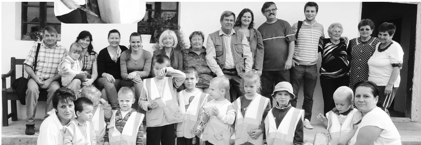
Ani deti z bátorskej škôlky nedokázali počas prechádzky odolať vôni čerstvo upečeného chlebička z dobovej pece, ktorá sa nachádza v tradičnom dome Kukurienka