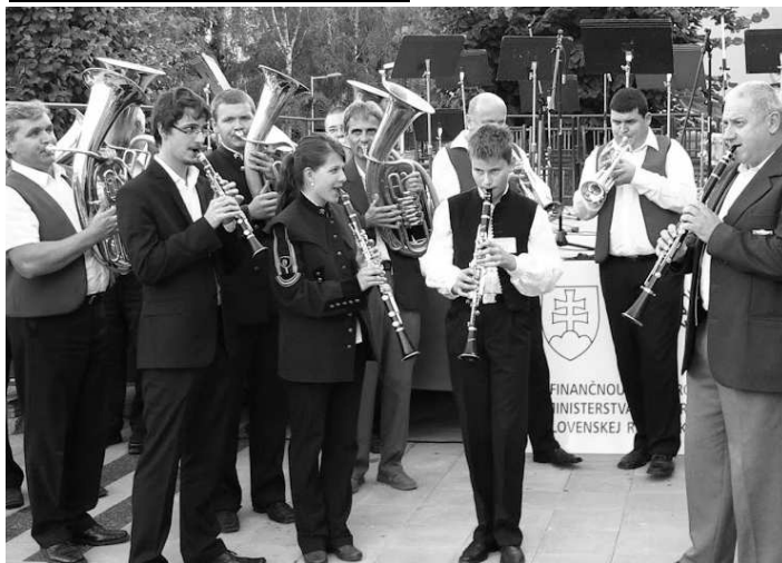
Monsterkoncert - všetci muzikanti si na záver zahrli spoločne