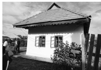
Tradičný ľudový dom Kukurienka, v ktorom sídli OZ Bathor 1478

ci na Vianoce a iné sviatky. Taktiež chceme spestriť zážitok návštevníkov pri návšteve rekonštruovaného ľudového domu rôznymi ručnými prácami a remeslami, ako napr. hmčiarstvo, drotárstvo, čipkárstvo, košíkovanie a to výrobu úžitkových a ozdobných