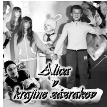
Grafika plagátu: Natália Jardeková

Pozývame vás na premiéru filmu Dominika Györgya Alica v krajine zázrakov, ktorá sa bude konať 20. 12. 2012 o 17:00 v kinosále Kultúrneho domu vo Veľkom Krτίši. Vstupné je ľubovoľné.