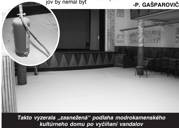
Takto vyzerala „zasnežená“ podlaha modrokamenského kultúrneho domu po vyčistení vandalov

POKROK SPRAVODAJSKÝ TÝŽDENNÍK • Vydáva Mgr. Ružena Hornáčeková - NOVAPRESS, Ul. SNP 29, 990 01 V. Krtíš, IČO 17 892 970, člen Asociácie vydavateľov regionálnej tlače na Slovensku v spolupráci s OZ Za spoločný Pokrok • Šéfredaktorka Mgr. RUŽENA HORNÁČEKOVÁ, zástupkyňa Bc. JANA KAMENSKÁ • Sídlo vydavateľa a redakcie Ul. SNP 29, Veľký Krtíš • tel./fax: 047/4830342,4831555, 4831333, 0902 302 102, 0918 59 65 65, 0910 989 479 • E-mail: noviny.pokrok@stonline.sk, www.pokrok.vkinfo.sk • Vychádza každý pondelok • Uzavierka čísla v stredu • Cena 0,55 eur • Rozširuje Slovenská pošta, š.p., súkromní distribútori a Mediapress, spol. s.r.o., Lučenec • Objednávky na predplatné prijíma redakcia • Podávanie novinových zásielok povolené OZ SsRP B. Bystrica č.j. 3721/OPČ 95 zo dňa 13.11.1995 • Za príspevky ďakujeme, nevyžiadané rukopisy a fotografie nevraciamy a neobjednané články nehonujeme, všetky informácie a fotografie uverejnené v týždenníku POKROK podliehajú autorskému zákonu č. 618/ 2003 • Registrácia Ministerstvo kultúry SR- EV 2798/08 • ISSN 1336 - 068 X