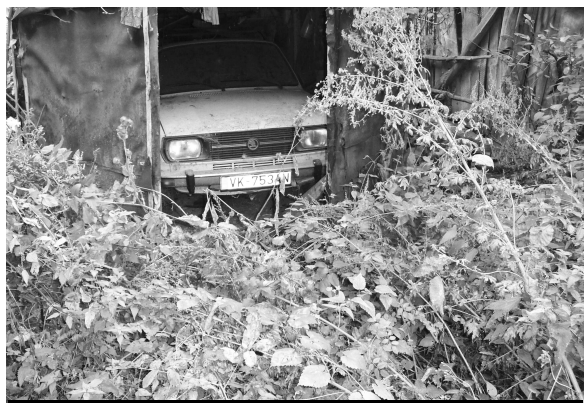
Táto stará škodovka zrejme svoju garáž už neopustí...