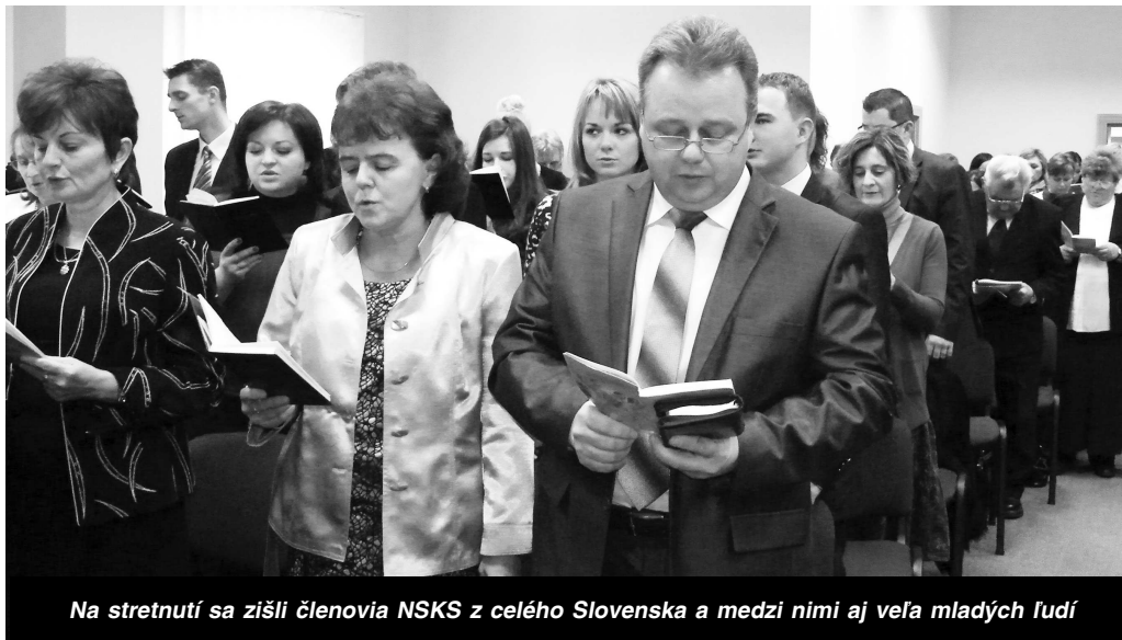
Na stretnutí sa zišli členovia NSKS z celého Slovenska a medzi nimi aj veľa mladých ľudí