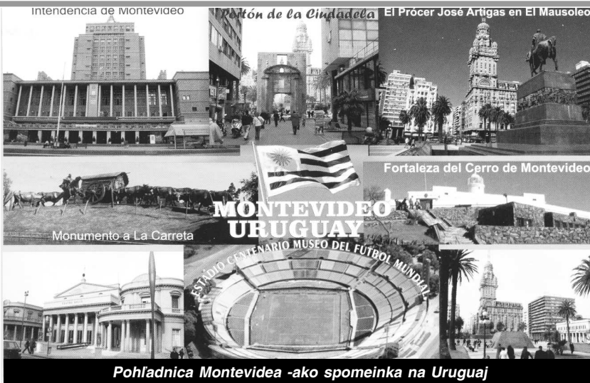
Pohľadnica Montevidea -ako spomeínka na Uruguaj

mentní. Ďalšou zvláštnosťou tam je, že nie je nič výnimočné vidieť na chodníku jedovaté hady - štrkáče i jedované pavúky. Milé ale bolo vidieť na vlastné oči pestrofarebné papagáje. Obyvatelia masovo od rána do rána popijajú čajovinu Mate z nádob pomocou kávovej trubičky a konzumujú najmä hovädzinu, ryby, kuracinu a bravčovinu so zeleninovými prílohami. Na uhasenie smádu používajú už spomenutý čaj a najmä šťavy z tropického ovocia. Počas voľna sme sa spolu s