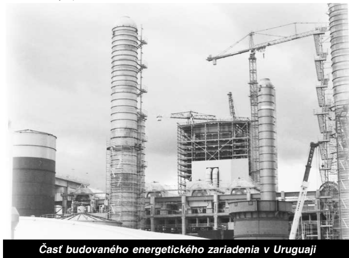
Časť budovaného energetického zariadenia v Uruguaji